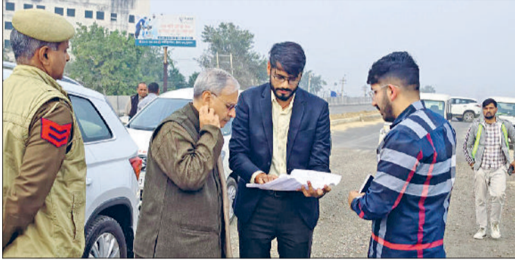
रेवाड़ी। केंद्रीय मंत्री का जानकारी देते हुए एनएचआई के अधिकारी।

रेवाड़ी को वाया पटौदी गुरुग्राम से जोड़ने वाले नेशनल हाइवे का निर्माण कार्य लगभग 2 साल की देरी से चल रहा है। इसे लेकर वीरवार को केंद्रीय मंत्री राव इंद्रजीत सिंह ने अधिकारियों को न सिर्फ फटकार लगाई, बल्कि पटौदी को केएमपी से जोड़ने वाले हिस्से का निर्माण 15 फरवरी तक पूरा करने के निर्देश दिए। उन्होंने अधिकारियों को लोगों के समक्ष आ रही परेशानियों से भी अवगत कराया। नेशनल हाइवे नं. 352-डब्ल्यू का निर्माण कार्य लगभग दो