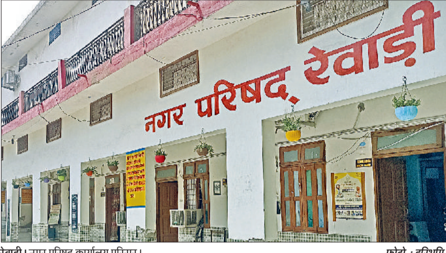
रेवाड़ी। नगर परिषद कार्यालय परिसर।

नगर परिषद की वार्ड बंदी को लेकर पंजाब एवं हरियाणा हाई कोर्ट में दायर दोनों याचिकाओं को वीरवार को हाई सुनवाई के दौरान खारिज कर दिया गया। याचिका दायर होने के बाद चुनावों पर रोक लगने की आशंका बनी हुई थी, जो अब दूर हो चुकी है। अब चुनाव समय पर होने का रास्ता साफ हो गया है। नगर परिषद की ओर से चुनावों की तैयारी देखते हुए नगर परिषद की ओर वार्ड बंदी कराई गई थी। शहर में इस बार एक वार्ड बढ़ाकर 32 वार्ड किए गए हैं। आरक्षण को लेकर गत 2 जनवरी को झूठे थे, जिसके बाद आरक्षित वार्डों का फैसला हो गया था। वार्ड बंदी के नोटिफिकेशन व आरक्षण को लेकर शहर के चार लोगों की ओर से 2 याचिकाएं हाई कोर्ट में दायर की गई थीं, जिनमें नई