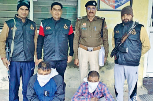
रेवाड़ी। पुलिस गिरफ्त में आरोपी।