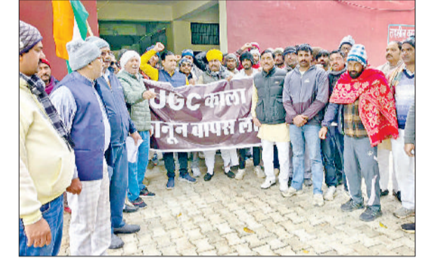
मंडी अटेली। अटेली तहसीलदार कार्यालय में विरोध करते हुए।

अटेली मंडी में वीरवार को यूजीसी एक्ट 2026 के विरोध में तहसीलदार कार्यालय में राष्ट्रपति के नाम ज्ञापन सौंपा। ज्ञापन में बताया कि हम देश के जागरूक नागरिक, शिक्षक, छात्र एवं सामाजिक कार्यकर्ता यह ज्ञापन प्रस्तुत कर रहे हैं। विश्वविद्यालय अनुदान आयोग यूजीसी द्वारा हाल ही में लाए गए नए नियम कानून देश की शिक्षा व्यवस्था, सामाजिक समरसता एवं संविधान की मूल