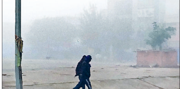
रेवाड़ी। वीरवार को सुबह छाया कोहरा, ठंड से बचाव करते युवक।

सप्ताह तक ज्यादा राहत मिलने की उम्मीद नहीं है। वीरवार को सुबह से ही घना कोहरा छाया रहा। कुछ एरिया में कोहरे की दृश्यता 30 मीटर तक रही, जिससे सड़क यातायात बुरी तरह प्रभावित रहा। सुबह लगभग 11 बजे तक घना कोहरा छाया रहा। दिल्ली-जयपुर व्यस्त नेशनल हाइवे पर वाहन रंगते हुए नजर आए। लाइट जलाकर वाहन चालक एक-दूसरे के पीछे चलते रहे। अन्य मार्गों पर भी वाहनों की रफ्तार धीमी रही। लंबी दूरी की आधा दर्जन ट्रेनों का संचालन भी कोहरे के कारण प्रभावित हुआ,