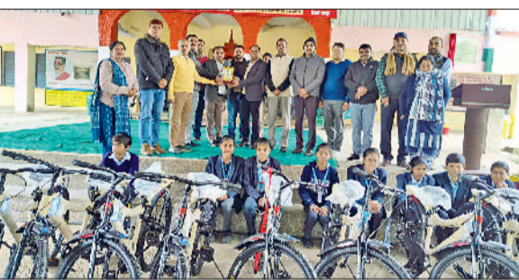
छात्राओं को वितरित की साइकिलें