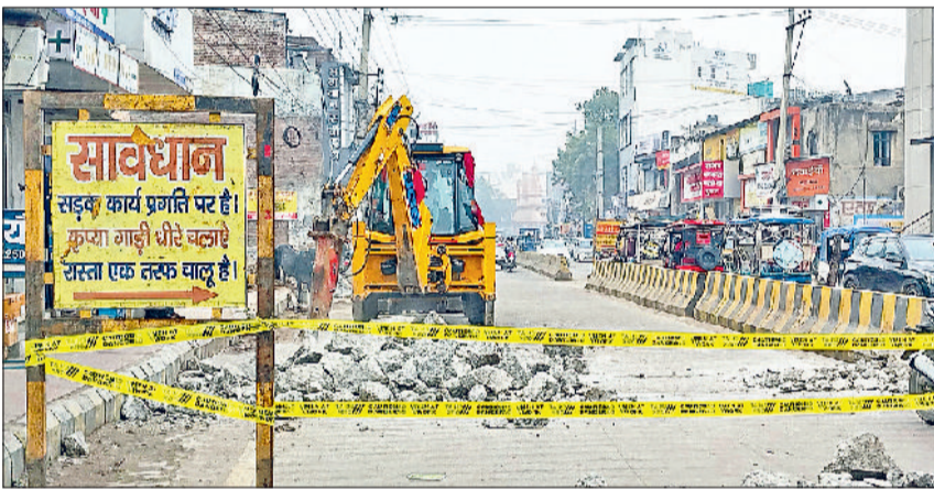
रेवाड़ी। सरकुलर रोड पर धारुहेड़ा चुंगी से लियो चौक के बीच सड़क तोड़ने हुए जेसीबी।

विभाग की ओर से इस जर्जर सड़क के नवनिर्माण के लिए टेंडर प्रक्रिया पहले ही पूरी की जा चुकी है और अब वीरवार से सीसी रोड निर्माण के लिए जर्जर सड़क तोड़ने का कार्य शुरू कर दिया गया