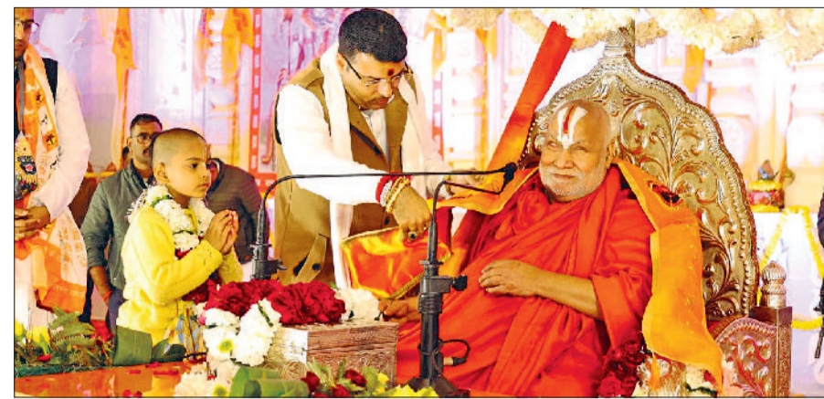
नारनौल। कथा सुनाते जगद्गुरु स्वामी रामभद्राचार्य।