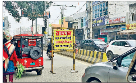
सड़क निर्माण कार्य के दौरान अंबेडकर चौक पर लगा सूचना बोर्ड।